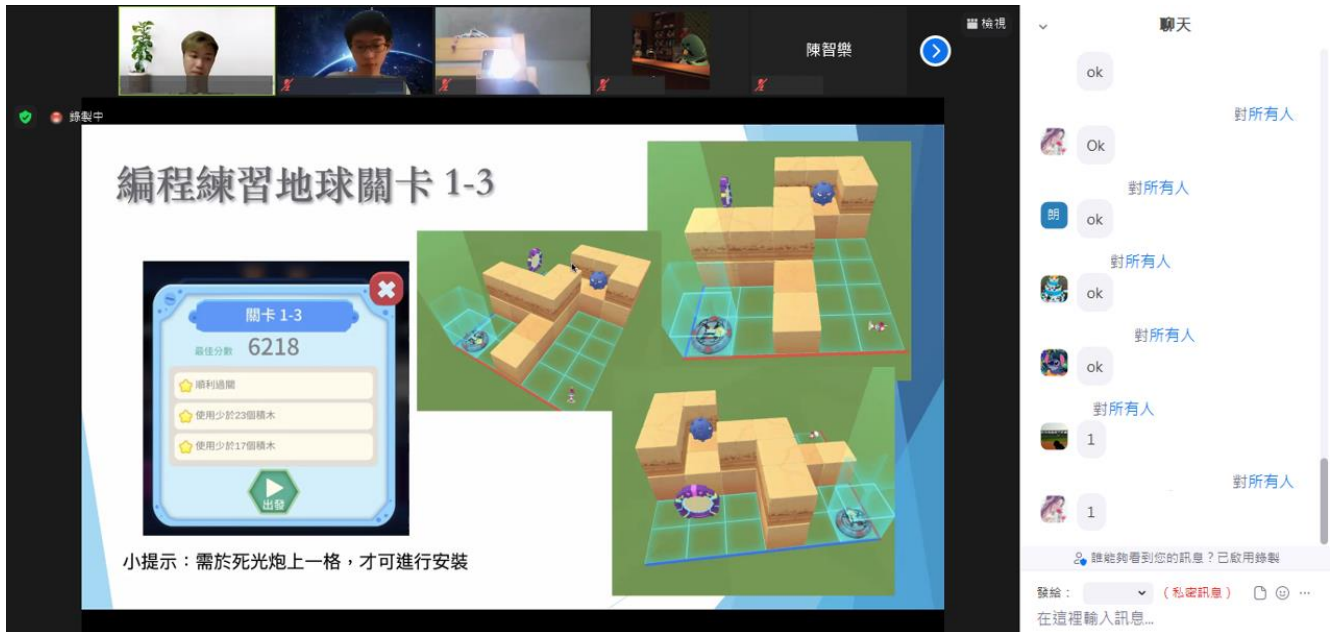
附圖：受疫情影響，「無人機 STEAM 訓練計劃」第一階段訓練部分課堂以網上形式進行。