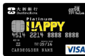
大新領匯 Happy Visa 白金卡

Happy卡去年率先於領匯旗下的 6 個商場推出，由即日起更擴展至另外 8 個領匯商場，包括太和廣場、小西灣廣場、禾峯廣場、南豐廣場、蝴蝶廣場、慈雲山中心、頌安商場及秀茂坪商場，令Happy卡的覆蓋點增至 14 個領匯商場。大新銀行更計劃將Happy卡陸續擴展至更多領匯商場，讓更多顧客及商戶受惠。