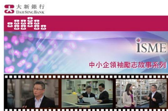
圖二及三：「iSME」網上銀行服務平台及「中小企領袖勵志故事系列」