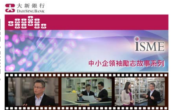
圖二及三：「ISME」網上銀行服務平台及「中小企領袖勵志故事系列」