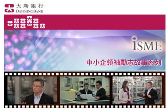
圖二及三：「iSME」網上銀行服務平台及「中小企領袖勵志故事系列」