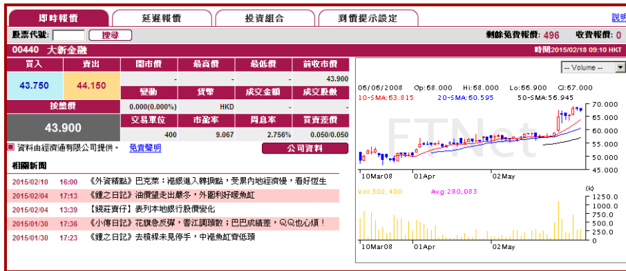
(經濟通 ET Net 版面)