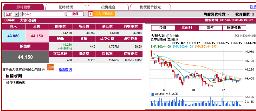
(天滙財經 MegaHub 版面)